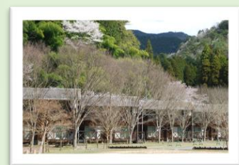
グリーンステーション鹿ヶ壺 コテージ・キャンプ場