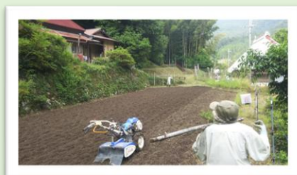
農業体験・共同作業に参加