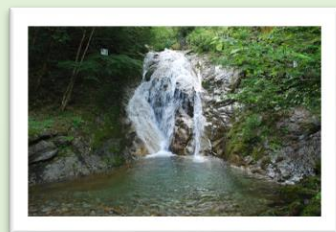
鹿ヶ壺・三ヶ谷の滝 ハイキング