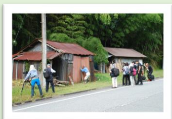
写真撮影、絵画 バードウォッチング