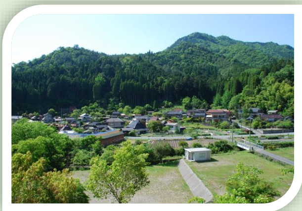
奥播磨かかしの里の山里風景