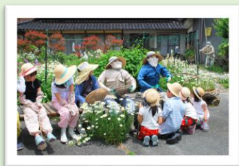
かかしの里のイベント参加