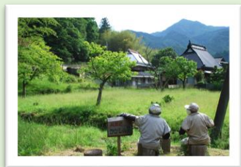
奥播磨かかしの里